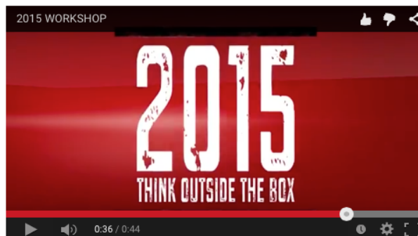
Teachers Workshop 2015

per i progetti didattici e per qualsiasi informazione prego di contattarci direttamente: info@bellbeyond.it o telefonateci: 0184 1898180