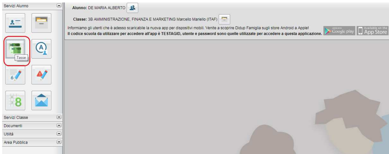
(accesso ai servizi di pagamento)

Il servizio di pagamento delle tasse e dei contributi scolastici è integrato all'interno di Scuolanext - Famiglia, ed è richiamabile tramite il menù dei Servizi dell'Alunno .